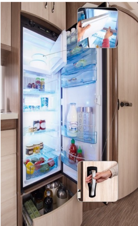
Refrigerador de 150 litros

Los paneles solares te dan gran autonomía en tu viaje