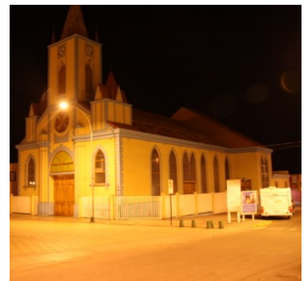
HOBBY DE LUXE EASY 490 KMF