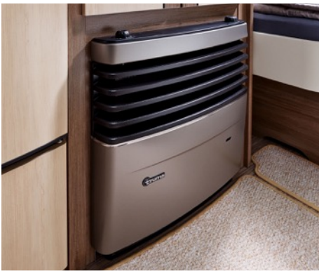
Todas las caravanas Hobby cuentan con calefacción Truma

Thule cuenta con una completa gama de accesorios para tu caravana Hobby, entre los que se destaca su portabicicletas. Como alternativas tienes un portabicicletas delantero, trasero o incluso uno que puedes agregar a las barras del techo de tu vehículo.